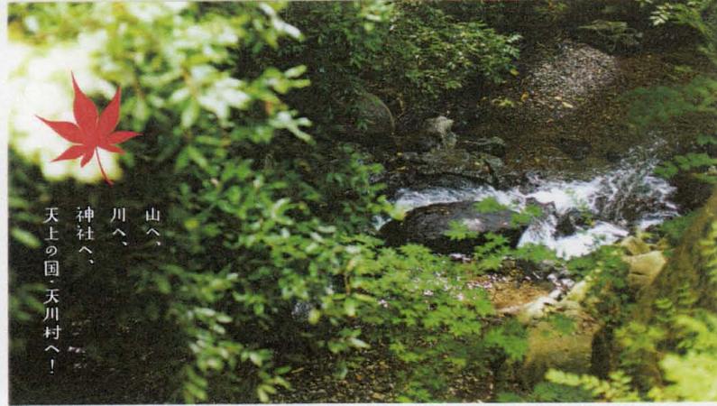
山へ、 川へ、 神社へ、 天上の国・天川村へ！

先略おえ気づりか？春さすり...以前から 行きたかった奈良の天徳神社の朝拝に行き 来季に、その後三重の橋大社での祈りの祭りに 参加して、平成三十年三月三日から心新たにス トンと上った。どちらか呼ばれたいと行きたい 即だそうと、まさに二日の秋田は空路、陸路共に悪天 候でホワイトアウトの状況で陸の孤島から盛岡まで 車で仙岩峠を越え、新幹線は盛岡から来京まで 三時間以上立ちまわし、九時向のサテ天川村に着い たのは夜で、それを京都から車で始めて、 エリアに入ると、何もかも美しく、満月の微笑 に導かれ無事到着。何やら私の運命を教え てもらえよう。こんな事もどう乗り越える のか、考え方と受け止め方の基準を上げて始 めて着は南かれ、試されてるのだと教えられ、 学ぶ身、信じる事、感謝が足りなかつた、心を して、頭を垂れて、沢山パワーを充電してま 子一たの、この回の弾丸ツアーの様子はおろそ びろびろにアゲた、お茶の淹れにのぞいて下 ませ、春は心むかう程体調はバランスもく かりまわりの、くれぐれもご自愛の上お返 下さい