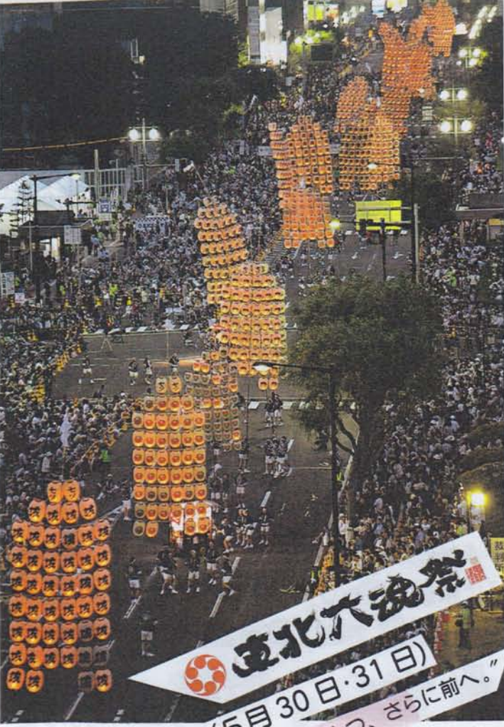
2015 秋田 (5月30日・31日) “東北の心はひとつ、さらに前へ。”

暑中・夏見舞申上ります。 お変わりごさるせんのか。花達が紫陽花 から朝顔に季節はひまわりが笑顔に 渡されていきます。夏が夕暮れは時折 ドキッとくる程ドラマチックな表情が語り のけて来る。頃子の。先日秋田で開催 された「東北六魂祭」は感動と感謝の二日間 でした。26万人の人の思いをのせて、 スナールは竹灯籠の灯りで東北の未来への 祈りと共に照らし続けた。来年は 青森の南催での祈りのバトンが渡され ました。さあセリオのホームページが少し づつリニューアルして今年のスタートアップが 見応えある内容になる予定です。 私の全国をまわって下さる方がこれからソコ んな情報をお知らせしていきます。